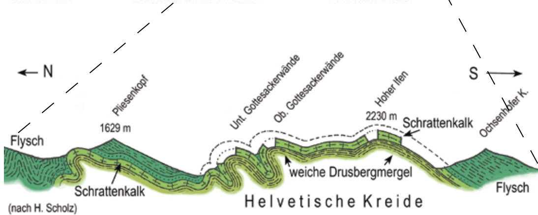
13 Hoher Ifen und Gottesackerplateau im Schnitt.